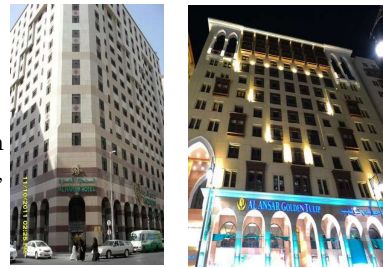
Al Haram –30M Anshor Golden