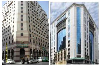
Al Haram –30M Rove Hotel-

Setelah sarapan pagi, dilanjutkan Zia-rah Kota Makkah:JabalRahma, Jabal Nur, Jabal Tsur, Arafah Mina Muzhali-fah diakhiri Jiarah ke Masjid Ja'rona, miqad bagi Umroh– 2